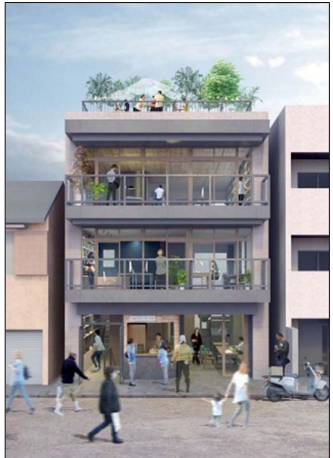
[交流拠点のイメージ]