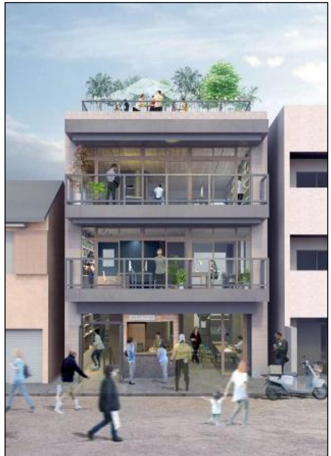
[交流拠点のイメージ]