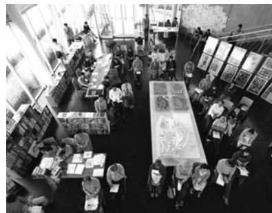
ガーデンシティ舞多聞でらいけプロジェクト公開講座(2010年齊木研究室撮影)