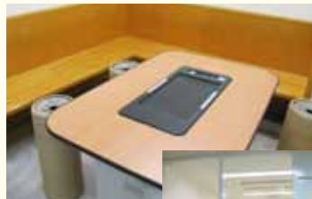
●KRP6号館 喫煙コーナー