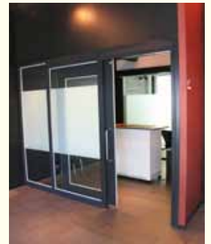
●KRP8号館 喫煙コーナー