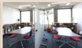
可動式間仕切り(ホワイトボード仕様)