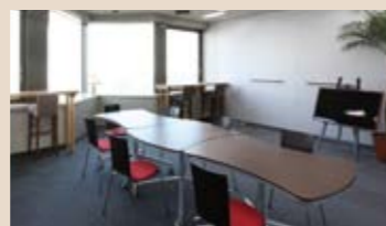
フレキシブルに移動可能なミーティングテーブル